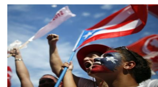
Porto Rico optou por tornar-se um estado americano.

... Porto Rico é uma república democrática , que está sob a jurisdição e soberania dos Estados Unidos, como território organizado não incorporado?