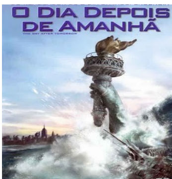
Filme: O dia depois de amanhã

Em suma, cabe à população participar da política. Para começar, basta rever conceitos e procurar pessoas e lideranças que conhecem o assunto, para que possam esclarecer sobre os primeiros passos que o cidadão precisa dar nesse caminho. Participar é exercer a democracia!