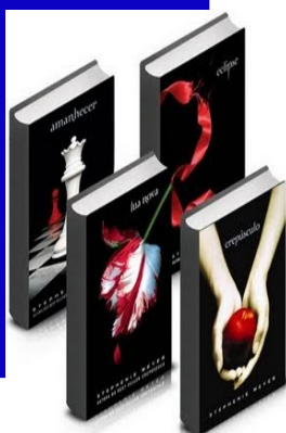
A saga Crepúsculo

Muitos adolescentes já leram e gostaram, pois a série conta a história de um casal que vive um amor impossível. Bella e Edward nos dão uma bela lição de como superar as diferenças e buscar a felicidade. Ao ter uma filha meio humana e meio vampira, eles conseguem provar que há caminhos intermediários.